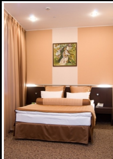
Alquiler de habitaciones por semanas (Valencia)